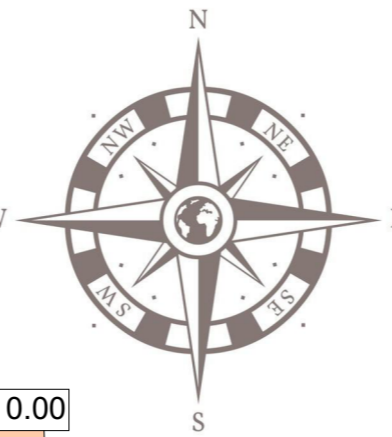
TABEL DE COORDONATE SISTEM DE PROIECTIE - STEREOGRAFIC 1970