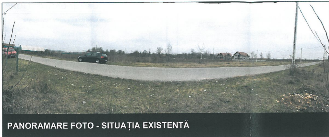
PANORAMARE FOTO - SITUAȚIA EXISTENTĂ