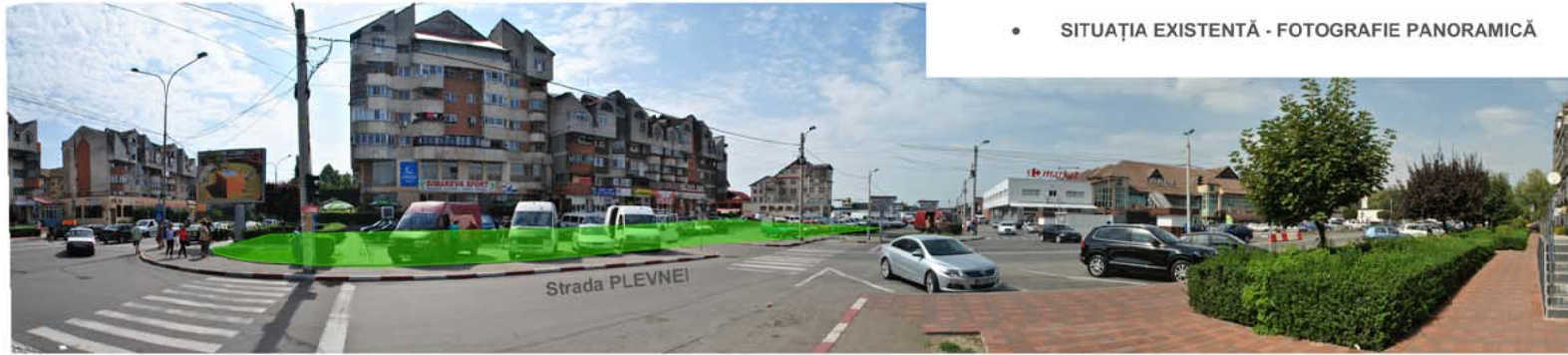
• SITUAȚIA EXISTENTĂ - FOTOGRAFIE PANORAMICĂ