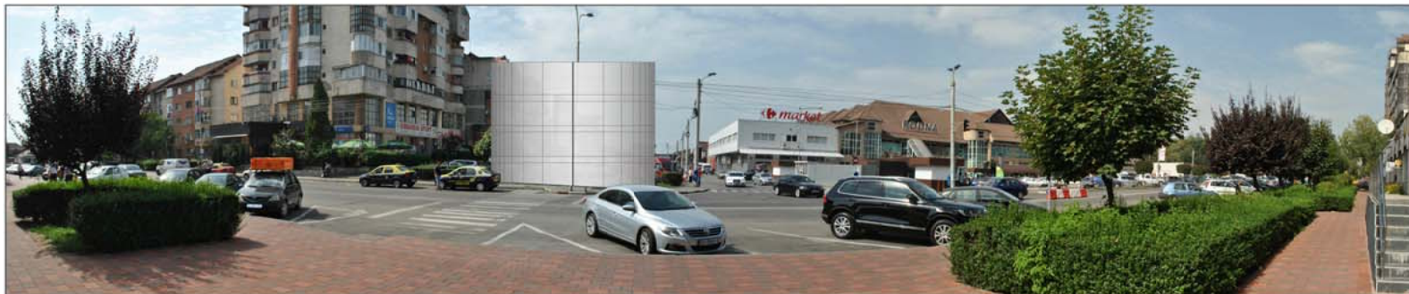
COLAJ FOTO - SITUAȚIA PROPUȘĂ